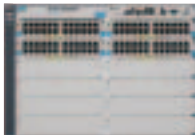
ProCurve Switch 5412zl-96G Intelligent Edge (J8700A)