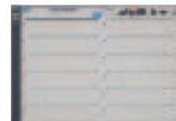
ProCurve Switch 5412zl Intelligent Edge (J8698A)